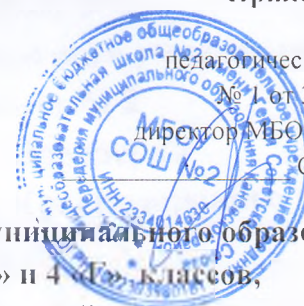
Таблица-сетка часов учебного плана МБОУ СОШ № 2 муниципального образования Каневской район Краснодарского края для 3 «Д» и 4 «Г» классов, обучающихся по адаптированной основной общеобразовательной программе для детей с задержкой психического развития, реализующих федеральный государственный образовательный стандарт начального • общего образования в 2020–2021 учебном году